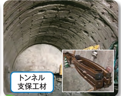
トンネル 支保工材