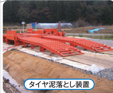
タイヤ泥落とし装置