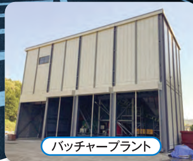
バッチャープラント

東京機材工業は創業以来、国内外のプロジェクトにおいて資・機材の受注製作はもとより、各種多彩なリースや保守管理も担っております。ご要望や用途に応じた資・機材の検討から納品まで一貫体制をとっており、的確できめ細か、かつ迅速に対応できる体制を整えております。