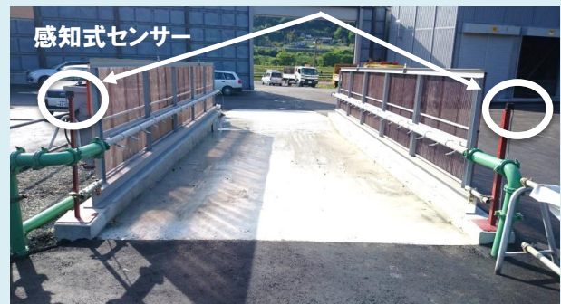
洗浄機進入口側写真