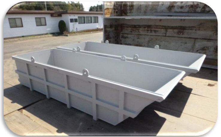
左よりベッセル12m 3 ・15m 3