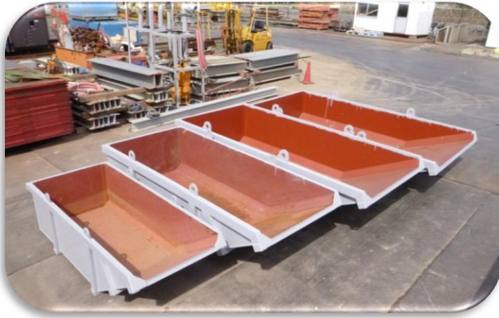
左より ベッセル1m 3 ・2m 3 ・3.5m 3