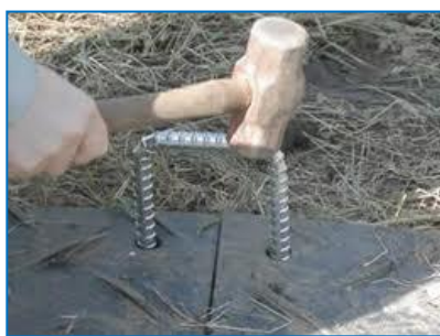
門型アンカー (地面用)