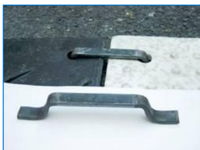
平型アンカー (コンクリート、アスファルト用)