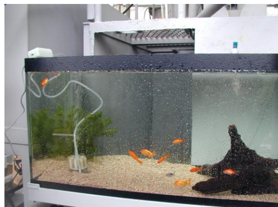
処理後の水で金魚を飼育